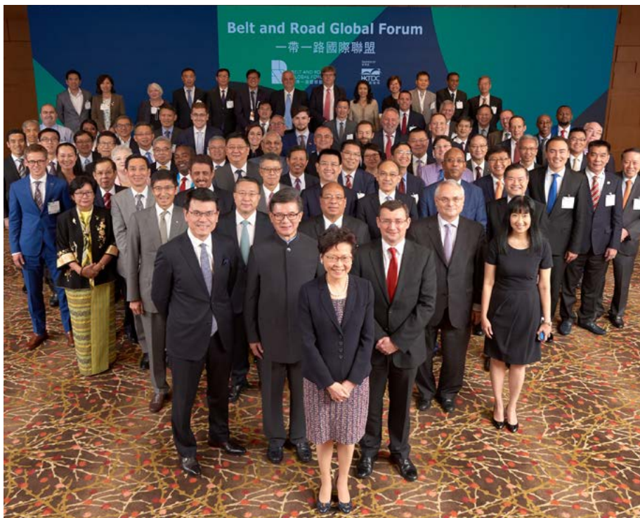
来自24国的80多个成员机构出席一带一路国际联盟成立仪式及首届圆桌会议，成立仪式由香港特别行政区行政长官林郑月娥主礼

由香港特别行政区政府及香港贸发局合办的第三届一带一路高峰论坛，亦于6月28日于香港会议展览中心圆满举行。