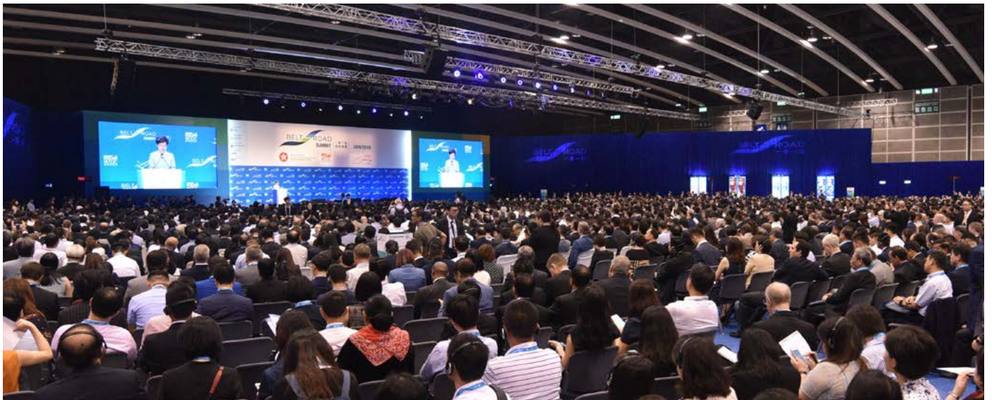
第三届一带一路高峰论坛以“全方位合作”为主题，吸引来自55个国家及地区约5,000名政商界精英参与

为配合“全方位合作”的主题，今年论坛的投资及商贸配对环节更延长至全日，为项目拥有人、投资者及服务提供者提供更多直接交流、商讨合作的机会。此外亦有三场投资项目介绍，分别展现“运输及物流基建”、“能源、天然资源及公用事业”以及“乡郊及城市发展”三大一带一路焦点范畴的项目及相关机遇。