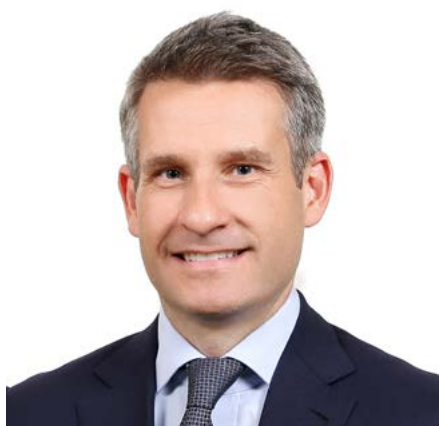
魏平 麦格理基础设施及有形资产投资基金

的答案是否定的。这一交易表明了该地区发展迅速、机遇庞大且日渐成熟，这的确令人惊叹。”